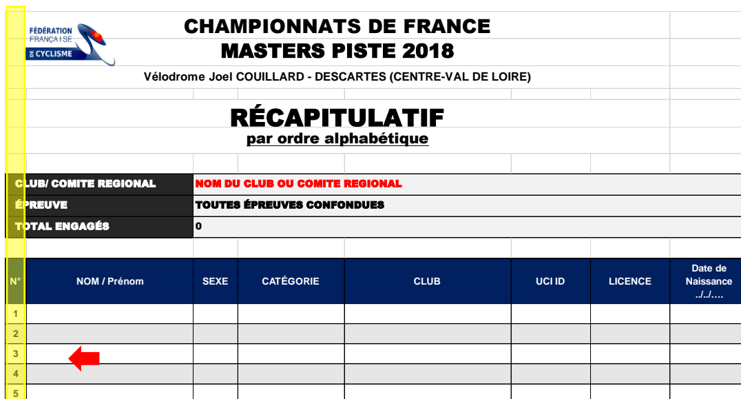
Figure 1 - Identifiant unique du coureur dans le tableau "Récapitulatif"

Une fois cette étape terminée, et pour faciliter la saisie des informations suivantes, nous vous conseillons d'imprimer cette feuille récapitulative . Seuls les numéros (identifiants) vous seront demandés par la suite.