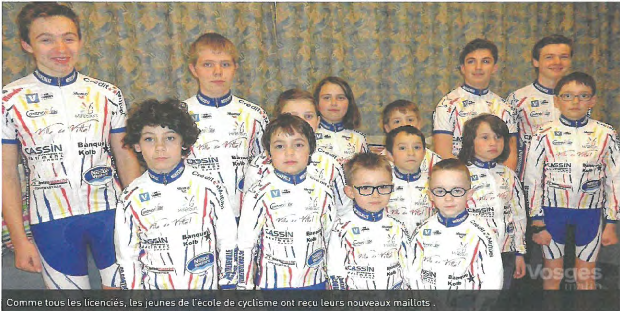
Comme tous les licenciés, les jeunes de l'école de cyclisme ont reçu leurs nouveaux maillots.

Née de la fusion des clubs cyclistes Contrexéville, Mirecourt et Vittel, l'UCCMV a maintenant ses propres tenues, travaillées avec un équipementier des Hautes Vosges. Elles ont été distribuées aux sportifs.